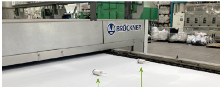
动态测定工艺温度的测量探头